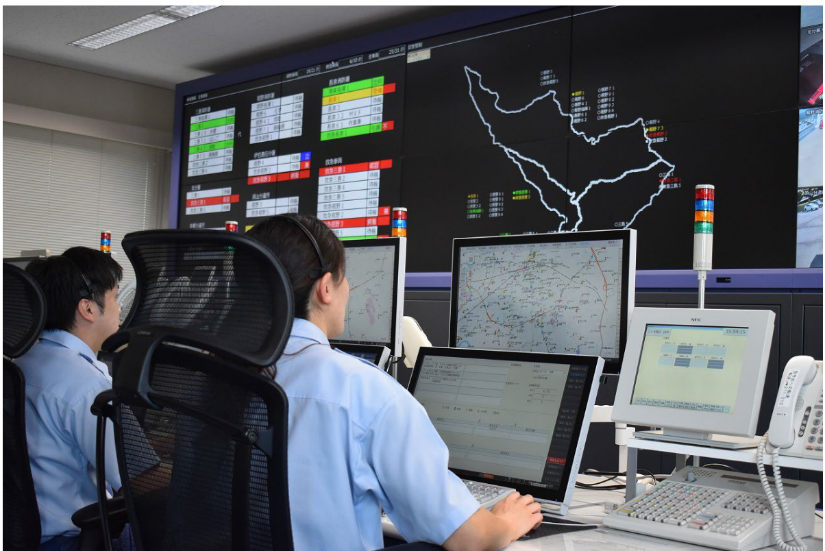
(消防指令センター)